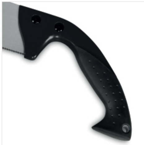
STEVIGE HANDGREEP Een duurzame en toch compacte handgreep die gemakkelijk in werktassen past.