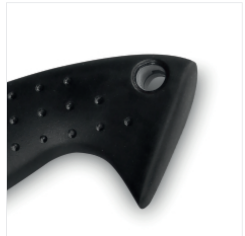
GAT VOOR OPHANGEN Praktisch gat om het gereedschap neer te zetten als je klaar bent.