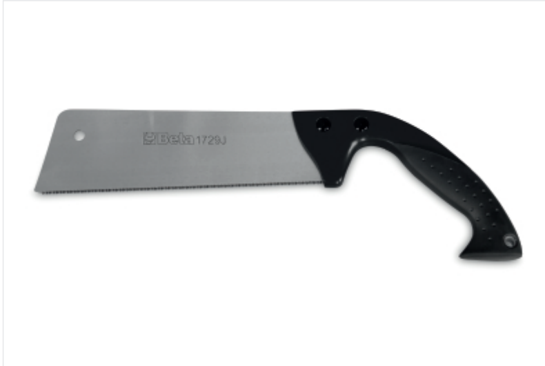
BETA 1729J Japanse zaag, trekschaar