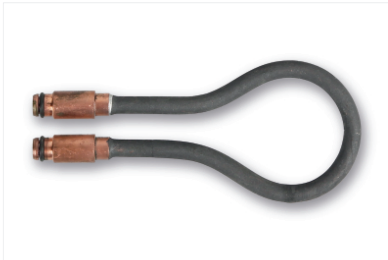
BETA 1852RL-S/40 Στρογγυλό πηνίο, \varnothing 40 mm, για τον επαγωγικό θερμαντή 1852RL3700