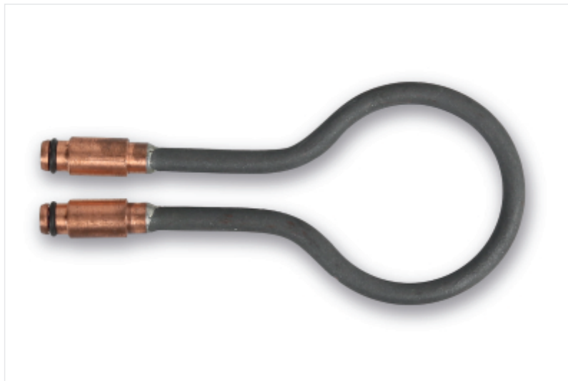
BETA 1852RL-S/45 Στρογγυλό πηνίο, \varnothing 45 mm, για τον επαγωγικό θερμαντή 1852RL3700