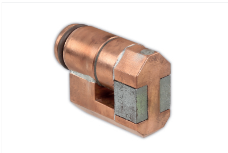
BETA 1852RL-S/D Serpentine dritte