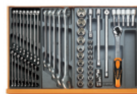
T05 T06 T80