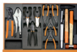
T153 T138 T145 T234