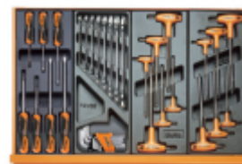
T208 T33 T52 T55