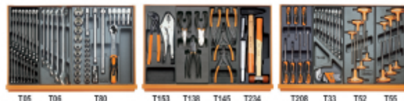
T05 T06 T80 T153 T138 T145 T234 T208 T33 T52 T55