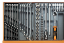
T05 T06 T80