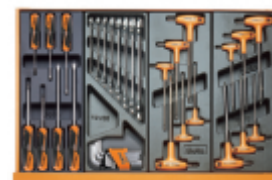
T208 T33 T52 T55