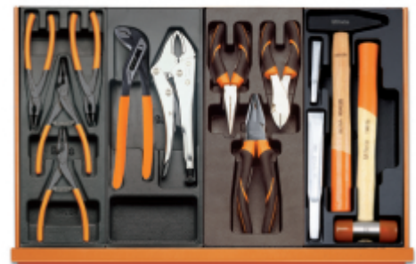
T145 T153 T137 T234