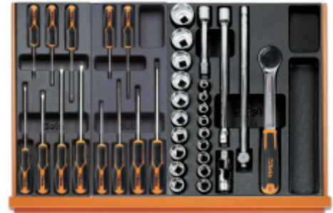
T199MH T202MH T83