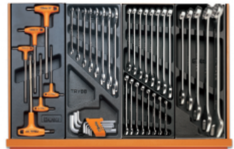
T52 T33 T05 T06