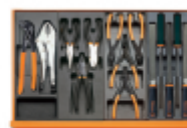
T153 T138 T145 T236