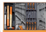
T234 T33 T208 T68