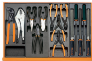
T153 T138 T145 T236