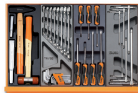
T234 T33 T208 T68