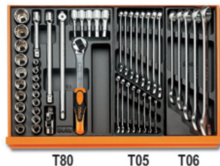
T80 T05 T06