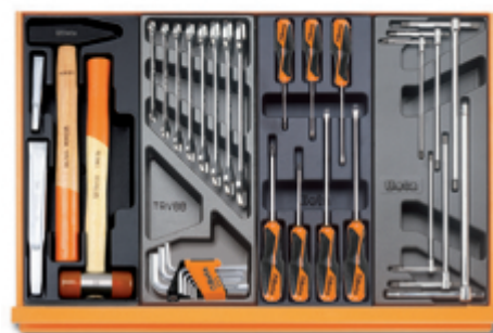
T234 T33 T208 T68