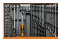
T80 T95 T06