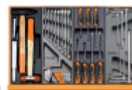
T234 T33 T208 T68