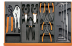
T153 T138 T145 T68

Scannez le code QR pour accéder à l'onglet Web