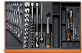
T40 T83 T91MH