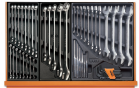
T05 T06 T31