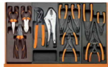
T137 T153 T145 T146

Scan de QR-code om toegang te krijgen tot het Specificaties, media en documentatie in één klik.