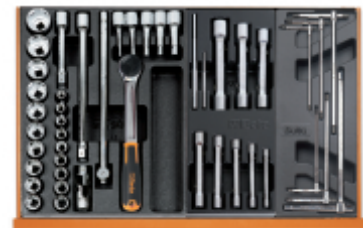
T80 T73 T68