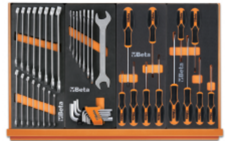
M05 M33 M204MH M180MH