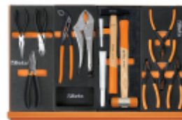
M137 M153 M234 M145