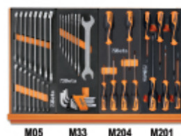
M05 M33 M204 M201