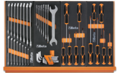
M05 M33 M204MH M180MH