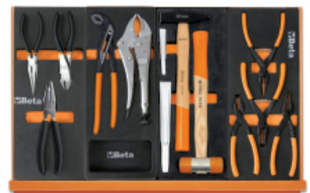
M137 M153 M234 M145

Scan de QR-code om toegang te krijgen tot het Specificaties, media en documentatie in één klik.