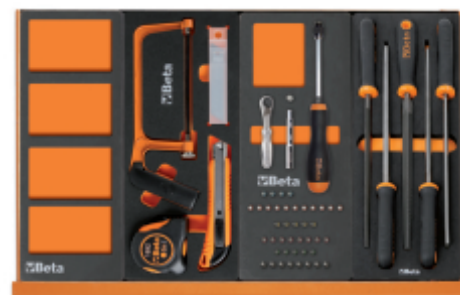
VPM3 M294 M85 M236