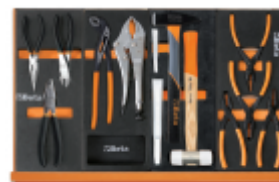
M137 M153 M237 M145