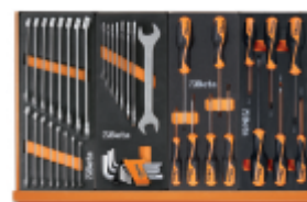
M05 M33 M204 M201