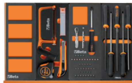
VPM3 M294 M85 M236