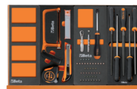
VPM3 M294 M85 M236