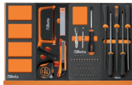
VPM3 M294 M85 M236