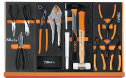
M137 M153 M237 M145