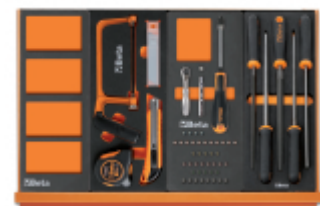
VPM3 M294 M85 M236

Scan de QR-code om toegang te krijgen tot het Specificaties, media en documentatie in één klik.