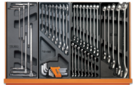
T68 T33 T05 T06