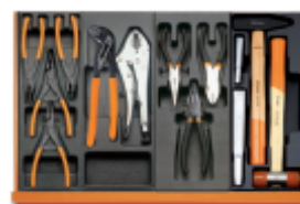
T145 T153 T138 T234