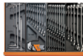
T68 T33 T05 T06