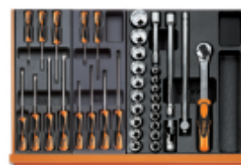
T199 T202 T83