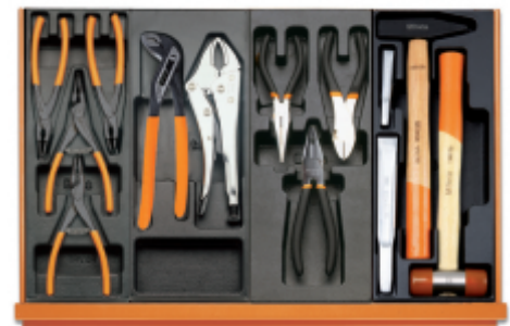
T145 T153 T138 T234