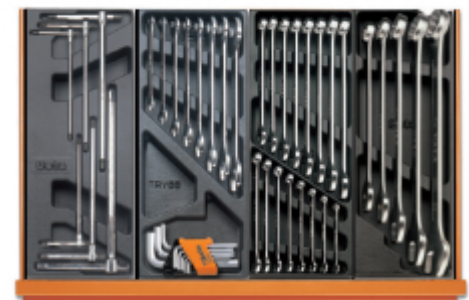
T68 T33 T05 T06