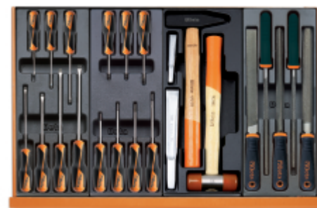
T198 T205 T234 T236