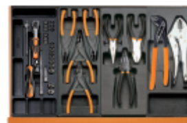
T91 T145 T138 T153