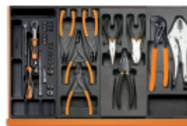
T91 T145 T138 T153