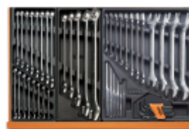
T05 T06 T31