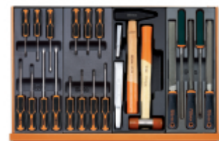
T208MH T205MH T234 T236

Scan de QR-code om toegang te krijgen tot het Specificaties, media en documentatie in één klik.