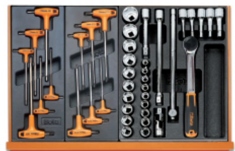
T52 T55 T80