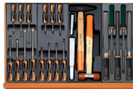
T198 T205 T234 T236