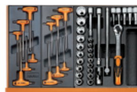
T52 T55 T80