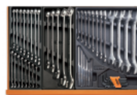
T05 T06 T31