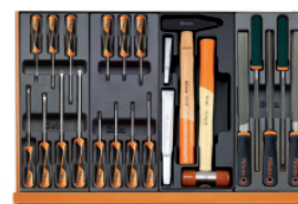
T198 T205 T234 T236