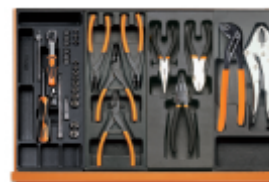
T91 T145 T138 T153