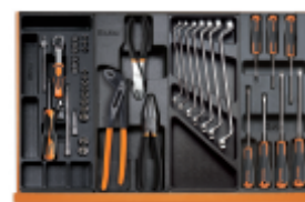
T91 T156 T40 T211