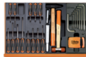
T213 T216 T234 T259