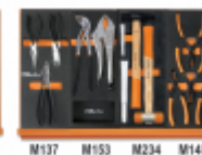
M137 M153 M234 M145