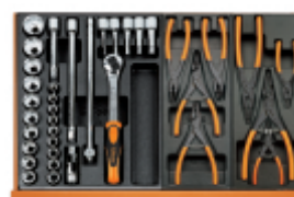
T80 T145 T146