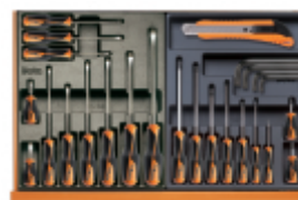
T167 T168 +06N +1771