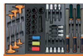
T55 T111 T113 T236