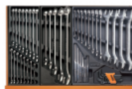
T05 T06 T31