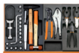
T264 T234 T153 T138