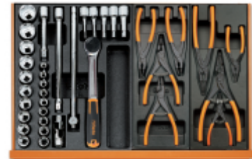
T80 T145 T146