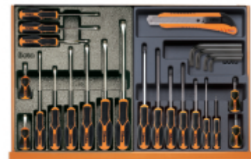
T167MH T168MH +96N +1771