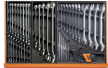
T05 T06 T31