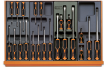
T199MH T202MH T201MH T204MH