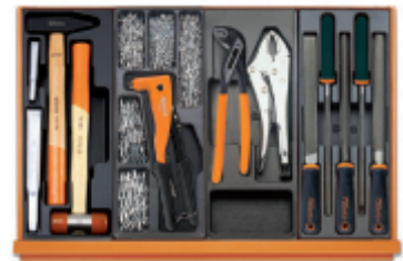
T234 T271 T153 T236

Escaneie o código QR para acessar a aba web Especificações, mídia e documentação em um clique.