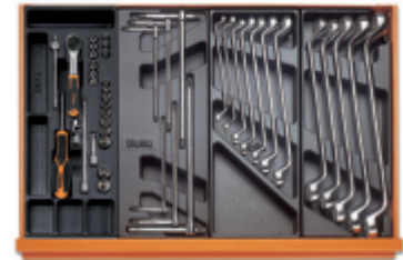
T91MH T68 T40 T41