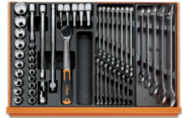
T80 T05 T06