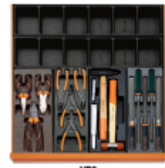
VP6 T137 T145 T234 T236

Scan de QR-code om toegang te krijgen tot het Specificaties, media en documentatie in één klik.