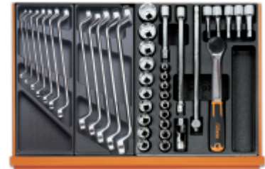
T40 T41 T80