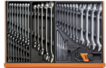
T05 T06 T31