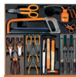
T279 T137 T145 T234 T236