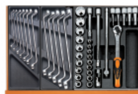
T40 T41 T80