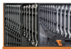
T05 T06 T31