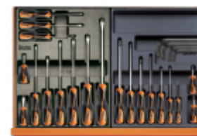
T167 T168 +96N