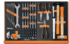
M33 M86 M136 M234

Scan de QR-code om toegang te krijgen tot het Specificaties, media en documentatie in één klik.