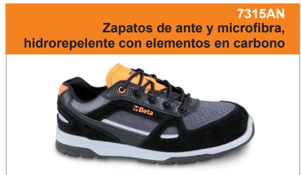
7315AN Zapatos de ante y microfibra, hidropelente con elementos en carbono