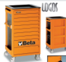
Sistema anti-queda Obriga a abrir e

Sistema anti-queda Obriga a abrir e fechar uma gaveta de cada vez, garantindo a estabilidade do carro e mais segurança